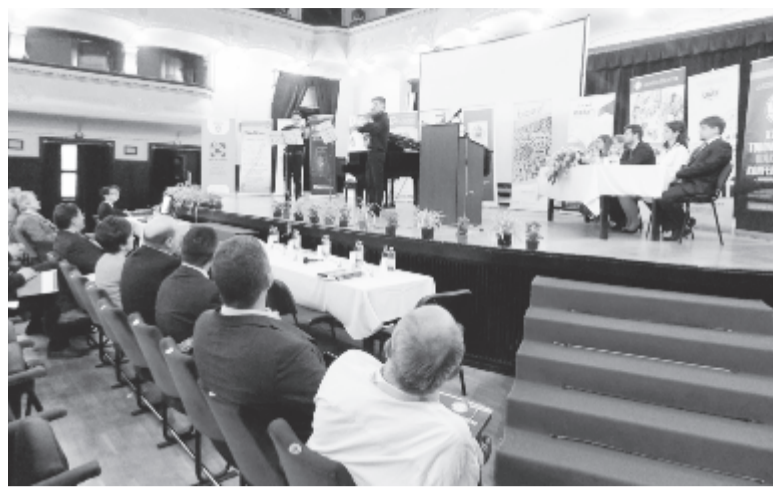
A megnyitón a Művészeti Szakliceum diákjai zenéltek